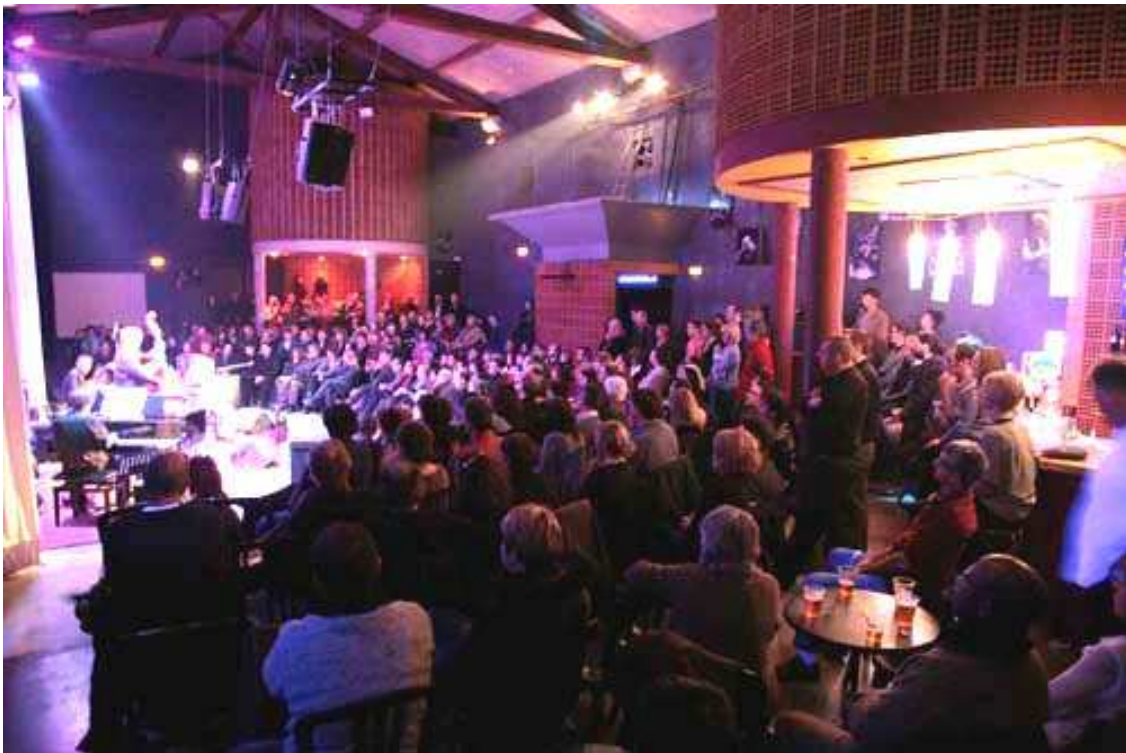
La salle de concert

Avec sa salle de concert « Michel Petrucciani » et son studio d'enregistrement, le JAM assure la diffusion de nombreux concerts chaque année, réunissant les formations de la scène internationale et nationale, tout en assurant aussi la promotion des groupes régionaux en devenir.